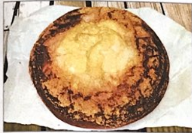
Mona de Pasqua.

Plats tradicionals de les nostres comarques són la paella o la fideuada. A més, tenim nombrosos dolços tradicionals com la mona de Pasqua, l'arnadí o la monjàvena.