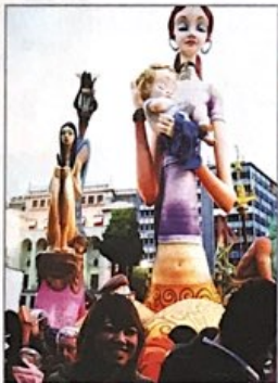
Falles de València.

Entre les festes tradicionals valencianes més conegudes hi ha les Falles de València, les Fogueres de Sant Joan, a Alacant, i la Magdalena de Castelló.