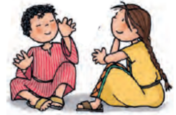
IMAGEN Y SEMEJANZA

¿Quiénes son los seres más importantes de la Creación? Tacha la letra inicial de cada dibujo y lo adivinarás.