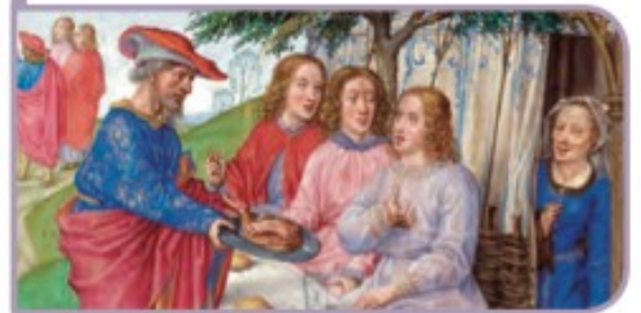
Abrahán y los tres ángeles (1520), miniatura del Libro de las Horas de Spínola, Museo J. Paul Getty, Los Angeles (Estados Unidos).

Al cabo de un año les nació un hijo, al que pusieron por nombre Isaac, que significa «risa».