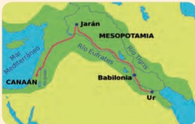
Itinerario del viaje de Abrahán de Ur a Canaán

Canaán es el nombre que recibía antiguamente la tierra situada entre el mar Mediterráneo y el río Jordán, en Asia. Actualmente coincide con Israel, Palestina y Líbano.